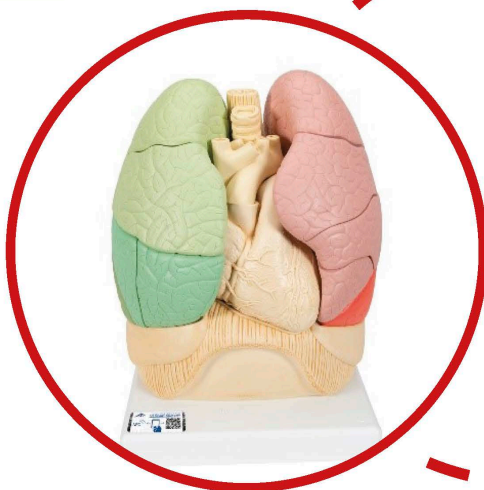
MODELO ANATÔMICO - PULMÃO SEGMENTADO 1 unid.

VOCÊ AVALIOU, A SÃO CAMILO FEZ! CPA SÃO CAMILO PARTICIPE!