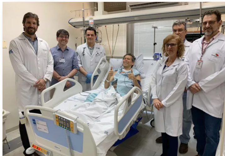
Equipe médica que atendeu ao aposentado no Hospital das Clínicas de Ribeirão Preto

Infográfico elaborado em: 30/08/2017 https://www.abrale.org.br/abrale