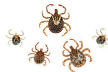
AMBIENTE FAVORÁVEL PARA PRESENÇA DE CARRAPATOS