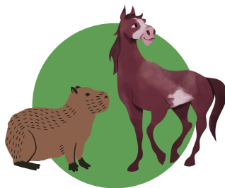
PRESENÇA DE HOSPEDEIROS