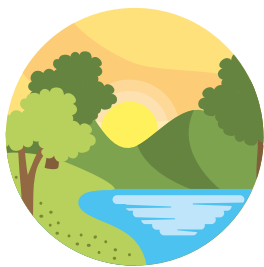
ÁREAS COM VEGETAÇÃO